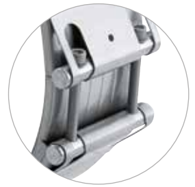
NORMACONNECT® FLEX 3 Rohrkupplung mit extra großer Bandbreite von 211 mm