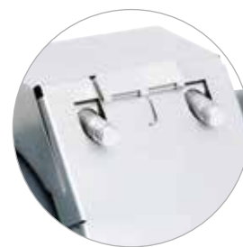
Doppelt verriegelte Sicherungen verhindern die versehentliche Demontage