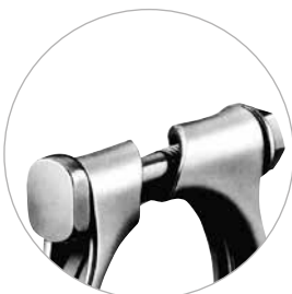
Version M8 mit Hammerkopfschraube.

** Unter Schraubenkopf (nur bei einzelnen Nennweiten).