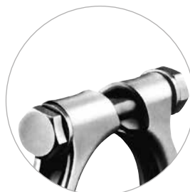
Version M10 und M12 mit Sechskantschraube.